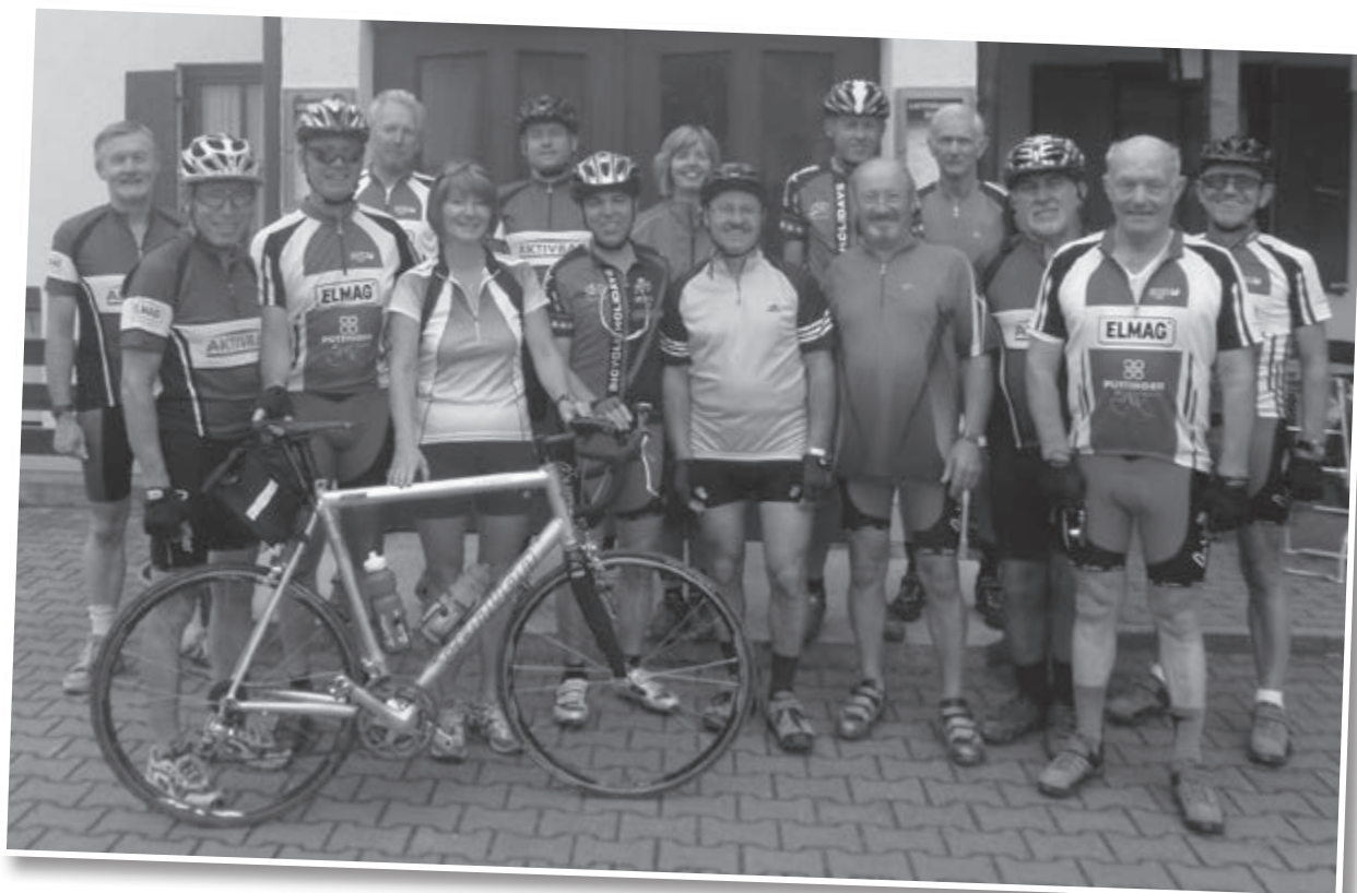
RAD-AKTIV Gruppe - Eine Verbindung von Sport – Gemeinschaft und Kultur