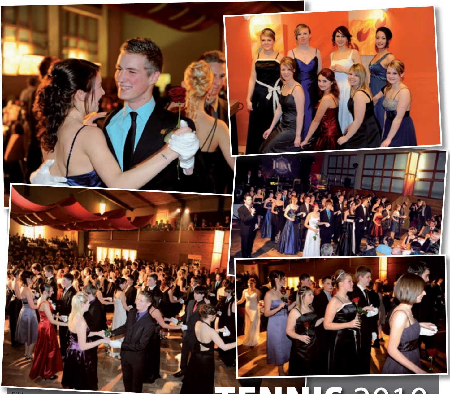
Bilder vom Unionball 2010