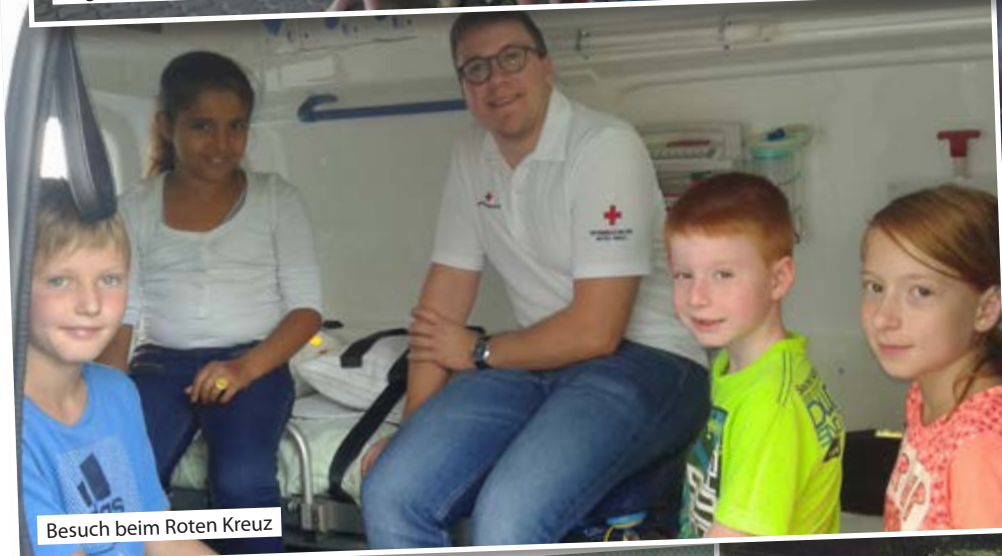
Besuch beim Roten Kreuz