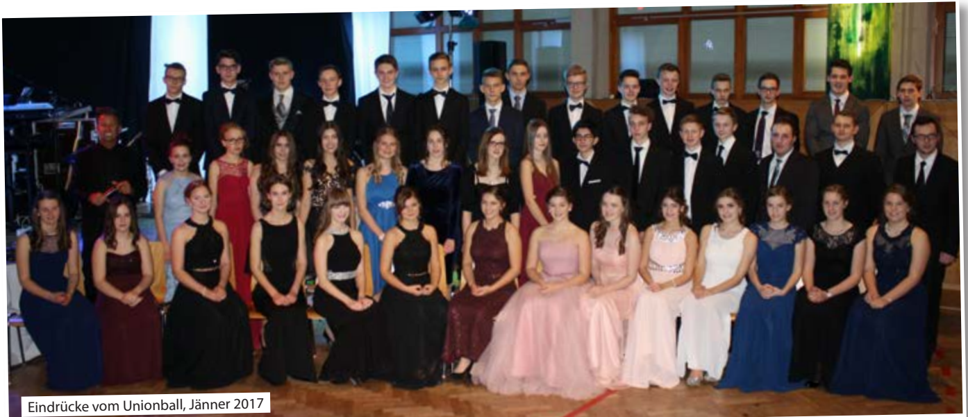
Eindrücke vom Unionball, Jänner 2017