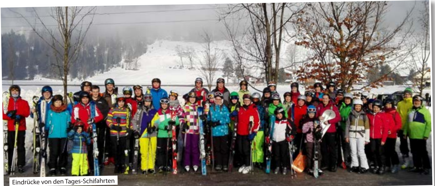
Eindrücke von den Tages-Schifahrten