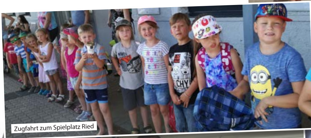
Zugfahrt zum Spielplatz Ried