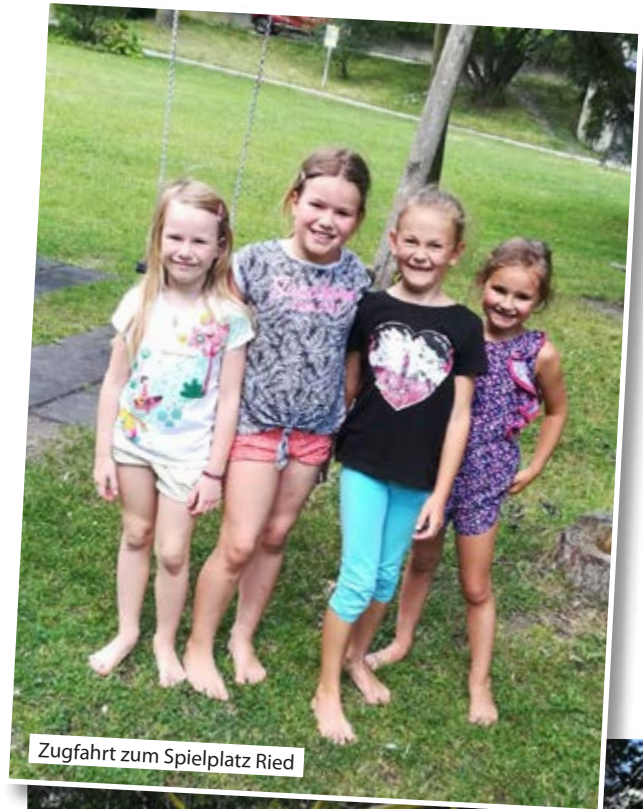
Zugfahrt zum Spielplatz Ried