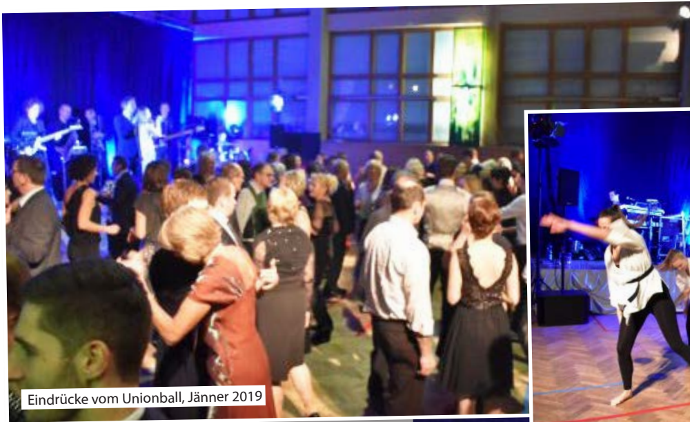
Eindrücke vom Unionball, Jänner 2019